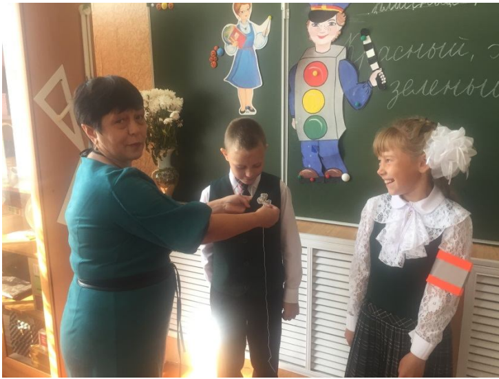
3-4 классы « Дорожная безопасность»