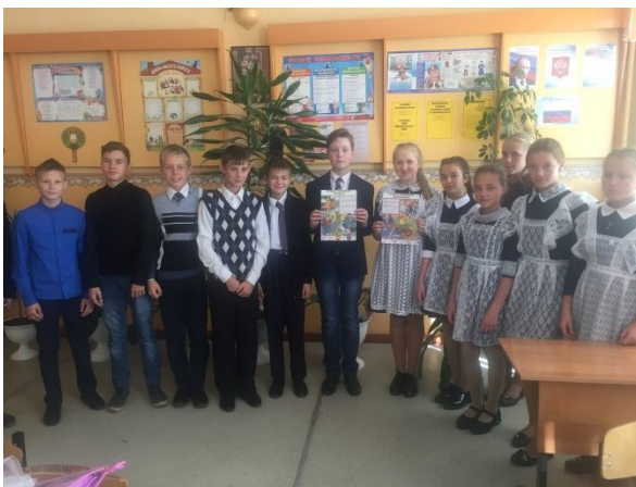
7-е классы «Правила управления мопедом и велосипедом»